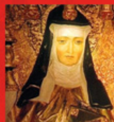
HILDEGARD VON BINGEN